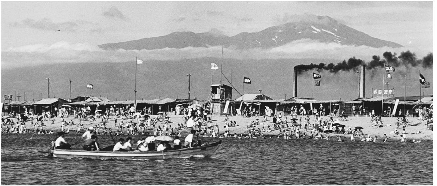
▲大浜海水浴場(昭和30年代)

戦後間もない昭和22年(1947)に開館し、開館70周年を迎えた本間美術館。酒田大火後の昭和53年(1978)に開館し、開館40年目を迎えた酒田市立資料館。長年にわたり酒田の文化向上、歴史・伝統の継承を目的に展示活動を行ってきた両館初の合同企画展です。