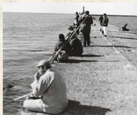
▲酒田港突堤での釣り風景(昭和34年)