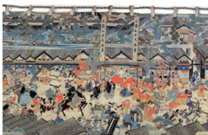
塞道絵幕 御壽和里大祭事-酒井侯御安堵祝宴-(部分) (酒田市指定文化財 / 酒田市立資料館寄託)