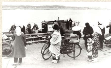
▲宮野浦の渡船場(昭和34年頃)

〒998-0046 山形県酒田市一番町8-16 TEL・FAX 0234-24-6544