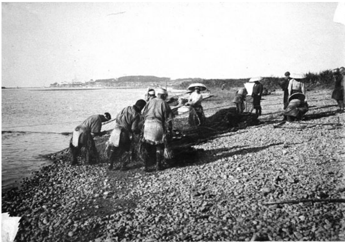
▲鮭の引網(大正時代)