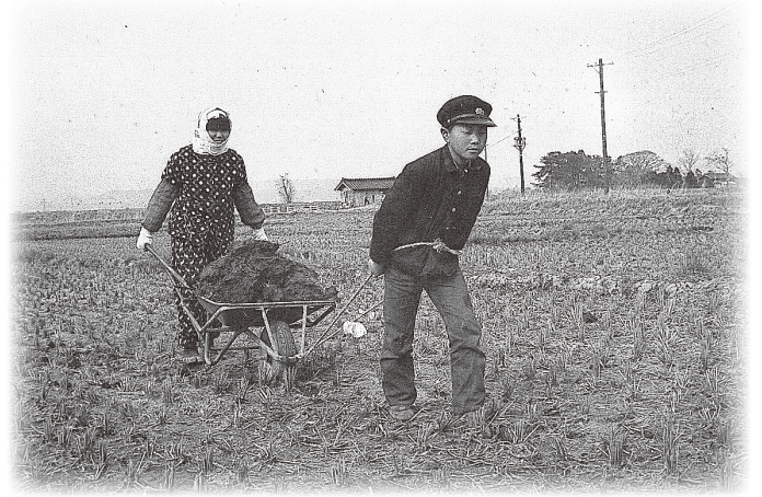
新堀の田んぼで堆肥運び(昭和40年頃)