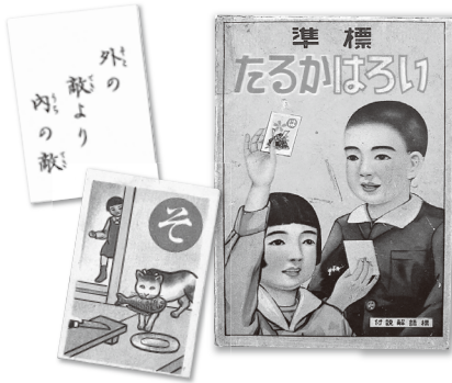
標準いろはカルタ(昭和期)