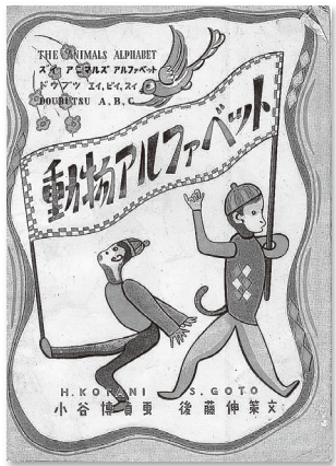
子ども向けの冊子(昭和21年発行)