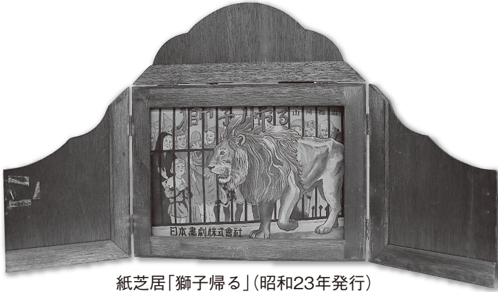
紙芝居「獅子帰る」(昭和23年発行)

時代とともにくらしが移り変わるなかで、いきいきと学び遊ぶ、子どもたちの姿をご覧ください。