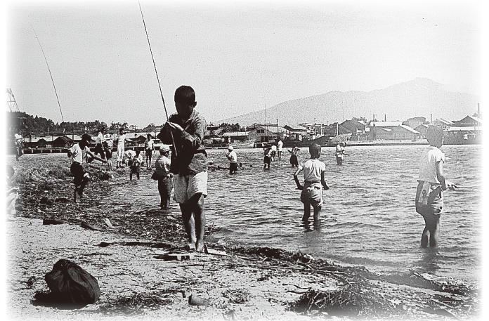
新井田川河口で子ども釣り大会(昭和28年頃)