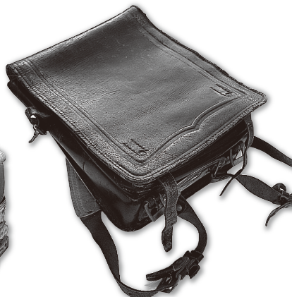
ランドセル(昭和期)