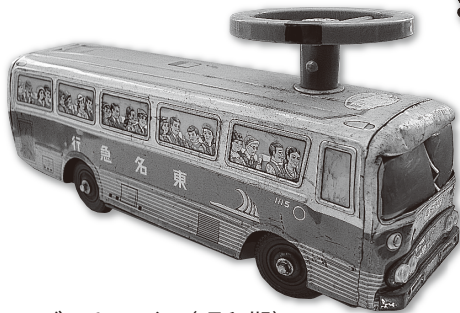
ブリキのバス(昭和期)