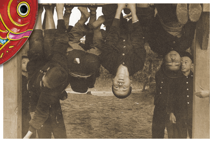
上：ままごと遊びをする子どもたち(年代不明) 中：光ヶ丘小学校の給食風景(昭和30年前後) 下：浜中小学校の子どもたち(昭和32年)