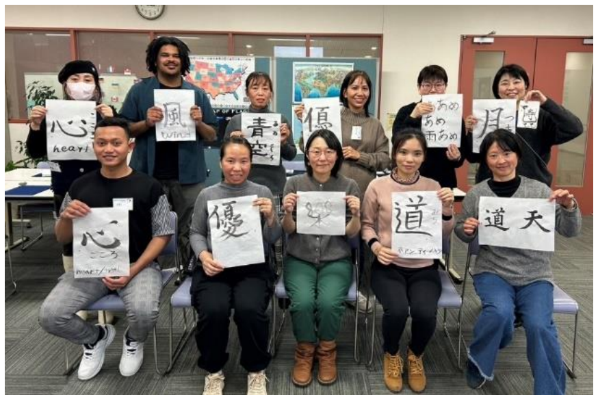
自分で書いたお気に入りの一枚を持って記念撮影。みんなで楽しく書けました♪