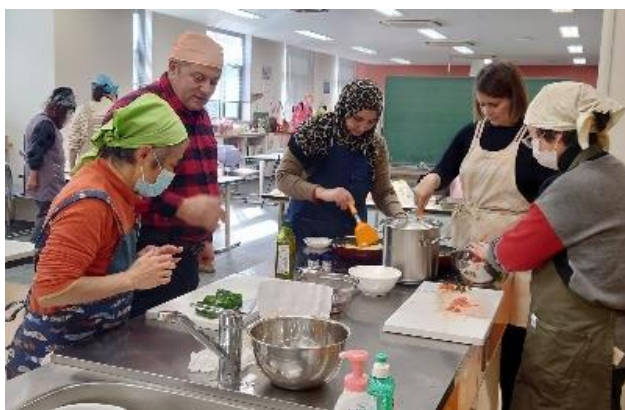
みんなで協力しあって調理を進めました♪