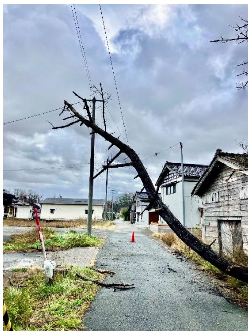
民有地からの倒木