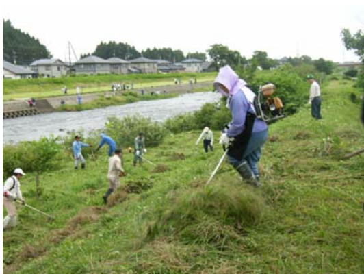
川をきれいにする運動（荒瀬川）