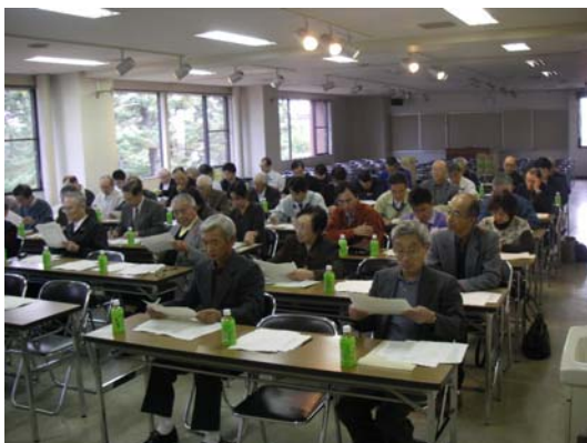
美化サポーター意見交換会の開催