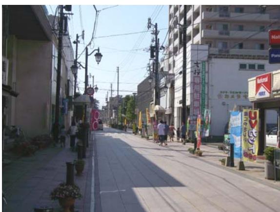
バリアフリーにより整備された道路