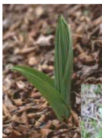
芽出し期の バイケイソウ