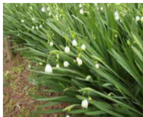
(スノーフレーク) (スズランスイセン)