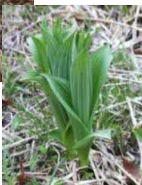
芽出し期の コバイケイソウ