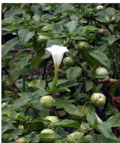
チョウセンアサガオの葉と花