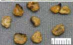
チョウセンアサガオの種