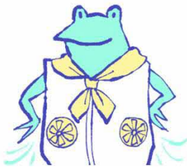
ファン付きウェア、 ネッククーラー