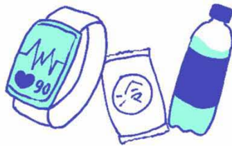
ウェアラブル端末、 応急セット