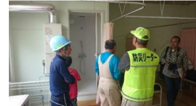
保健室にシャワー設備あり いいね