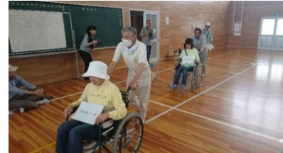
要援護者、妊婦 → 保健室へ