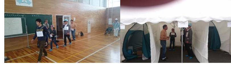
ペットを連れてきた人が避難 → ペットは屋外テントに