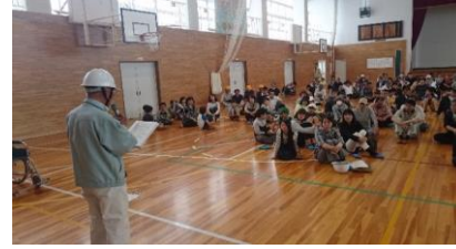
避難所運営訓練の説明

昨年度、酒田市総合防災訓練において図上の避難所運営訓練を実施した富士見学区自主防災連絡協議会では、収容できる人数の少なさと要支援者、外国人やペットの対応など多くの課題があるとこを実感した。今回、富士見小学校と連携しながら、地域全体でその課題を共有するために避難所運営実地訓練を実施した。 今後、このような取り組みを拡大していきたい。 そして、継続的な話し合いにつなげていきたい。