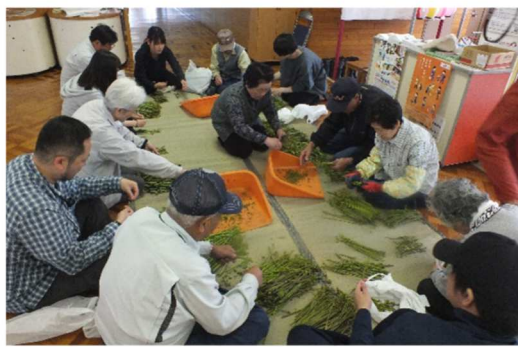
体験・交流による人（人財）づくり 【ワラビ干しの様子】

見守り、買い物支援（移動販売等）、雪かき、弁当の配食の支援等、住み慣れた地域での生活を支え、生きがいを持って暮らせる仕組みをつくるため、各地区へ出向き対話や雑談で地域の声をひろう「移動するコミュニティ」を実施中です。