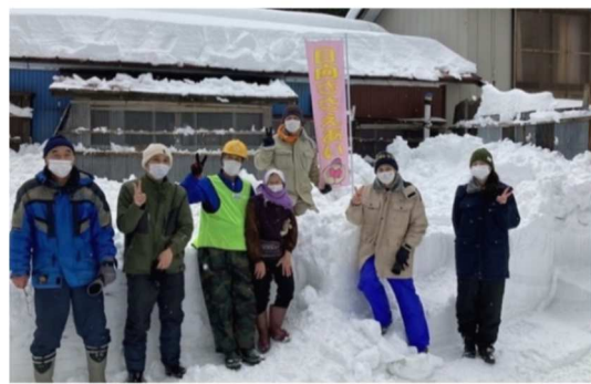
日常生活を支える仕組みづくり 【除雪ボランティア】