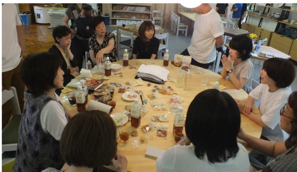
日常をささえる仕組みづくり【移動販売用商品検討会】