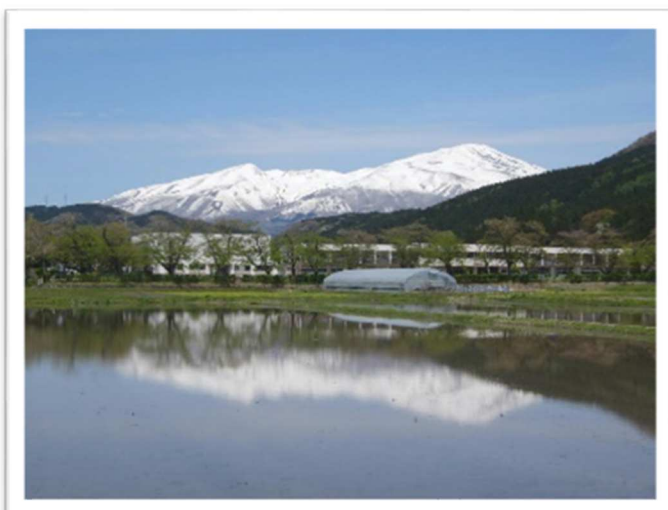
八幡総合支所から見える鳥海山