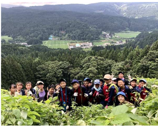
八幡小学校の児童と「大」文字のライト設置

日本全国の地方が人口減少と高齢化が進む課題を抱えている中、持続可能な「超高齢化先進地域」のモデルケースを目指し、有償の除雪支援、刃物研ぎ、網戸張り替えなど、社会福祉・生活支援の取り組みを行っています。