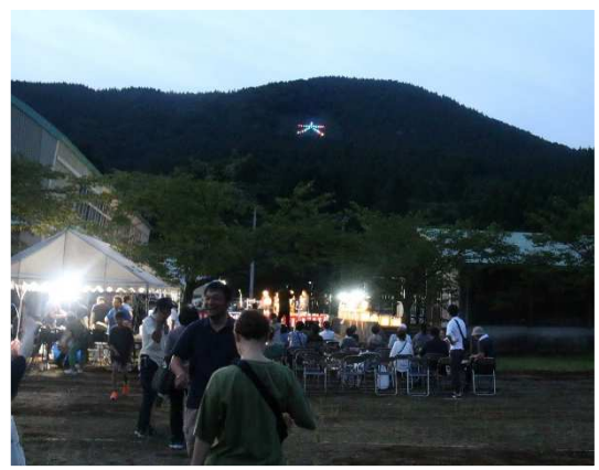
八幡小学校の児童が色配置をデザインした7色の「大」文字ライト点灯 やわた大沢「大」文字まつり