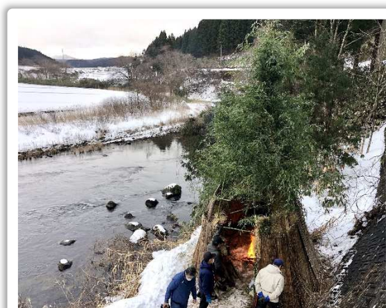
大沢地区・山添の伝承行事「さんど（賽道）小屋」