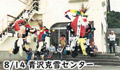
8/14 青沢克雪センター