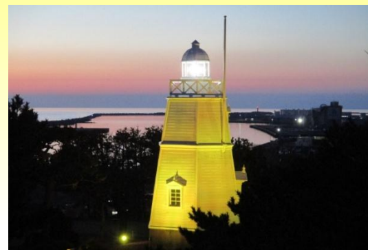
日和山公園六角灯台イエローライトアップ