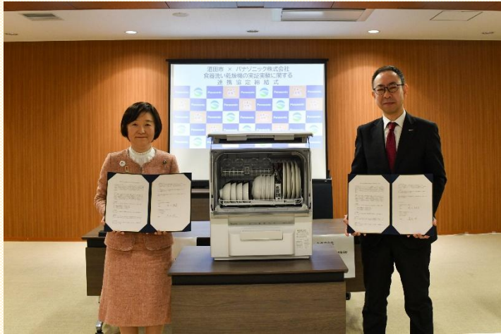
協定締結式の様子

本市は、令和8年2月13日、パナソニック株式会社と「食器洗い乾燥機の実証実験を通じた男女共同参画の推進に関する連携協定」を締結しました。