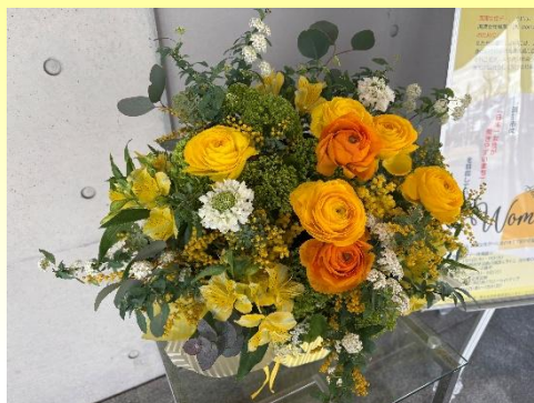
市役所正面玄関でのイエローフラワーの展示