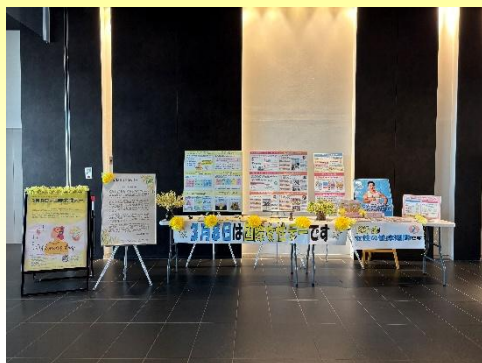
ミライ二光の湊ロビーでの啓発展示

私たちの暮らしの中には、まだ気づかれにくい不平等や無意識の偏見が残っています。身の回りの小さな違和感に目を向け、互いを尊重する思いやりの気持ちを広げていくこと。それこそが、より良い社会への確かな一歩になります。本市では、国際女性デーに合わせ、下記の取り組みを実施しました。