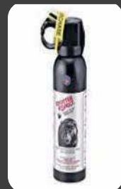
クマ撃退スプレー