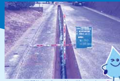
硬質塩化ビニル管の改良工事