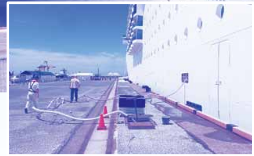
岸壁付近には船舶に給水するための施設があります