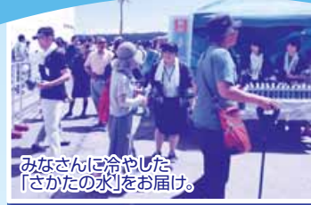
みなさんに冷やした「さかたの水」をお届け。

【編集・発行】 酒田市上下水道部 酒田市末広町14-14 0234-22-1812