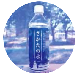
イベントなどで好評です。

これから、このようなクルーズ船の寄港が増えてくることが予想されます。世界中のだれからも「酒田の水はおいしい」と言っていただけのように、より一層の品質管理に努めてまいります。