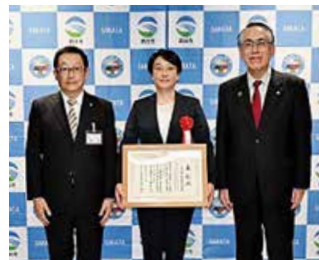
五十嵐工業株式会社

上下水道事業の請負工事のうち、事故防止対策に尽くし、建設技術の向上に寄与する等、他の模範となった企業を表彰するものです。令和3年は2企業が受賞されました。