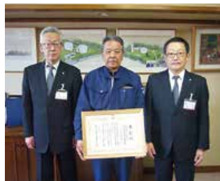
安田池田組・丸和水道特定建設工事共同企業体