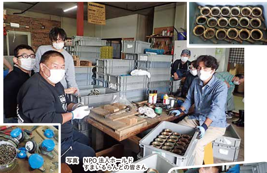
写真 NPO法人ホールド すまいるらんの皆さん

編集・発行 ● 酒田市上下水道部 酒田市末広町14-14 ☎0234-22-1832