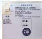
電動式 (操作パネル)