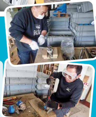
撮影のためマスクを外しています

上下水道部では、平成25年から障がい者就労施設に、使用済み水道メーターの分解業務を委託しています。今年度は約7,000個の水道メーターを分解して、金属部分を納品していただきます。力仕事や細かい作業も多く、皆さん真剣な眼差しで、生き生きと仕事に取り組んでいます。