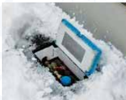
除雪後の メーターボックス