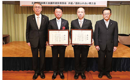
酒井鈴木工業株式会社