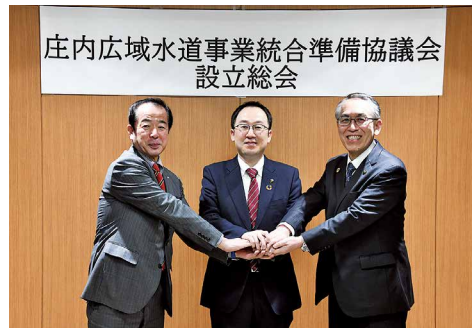
左から富樫庄内町長、皆川鶴岡市長、丸山酒田市長