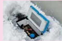
除雪後のメーターボックス