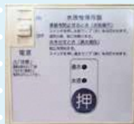
電動式 (操作パネル)