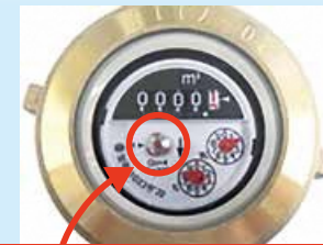
パイロットをご確認ください

注意：漏水修理費用は自己負担です。こまめに水道メーターを確認すれば、突然の負担が軽減されます。