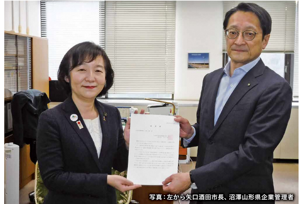
写真：左から矢口酒田市長、沼澤山形県企業管理者

編集・発行 ● 酒田市上下水道部 酒田市末広町14-14 ☎0234-22-1812