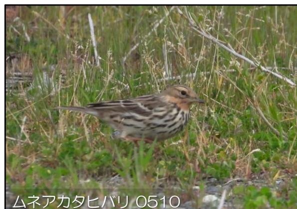
ムネアカタヒバリ 0510