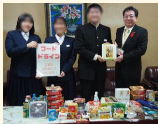
贈呈する生徒たち

本活動は、食を大切にする意識を育むとともに、社会課題への理解を深め、地域を巻き込みながら主体的に行動する力の育成につながっています。