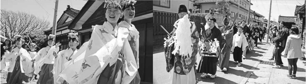
「浜中地区 石船神社例大祭」