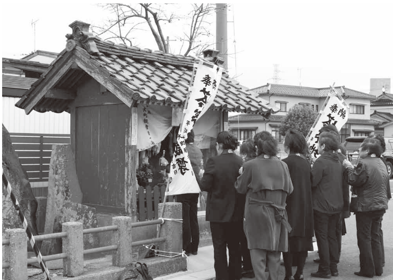
「村内安全・無病息災の祈りを込めて ～塔婆地蔵祭～」 (大町)