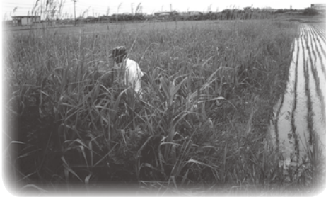
農地は守るべき地域の財産です

さらに農作物からの蒸散作用は、近年の夏季の気温上昇を和らげるための温度調整機能もあり、農地は多くの役割を担っています。