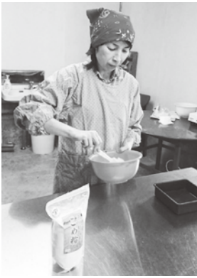
自家製米粉で菓子作り

今は、3人の子育て真っ最中ですが、一段落した際には自分で農作物の栽培に挑戦したいと思っています。また、それらを利用していろいろ加工品を作るのが夢です。まだまだ育児は忙しいですが、「無理なく楽しく」をモットーに「農ライフ」を続けて行きたいです。