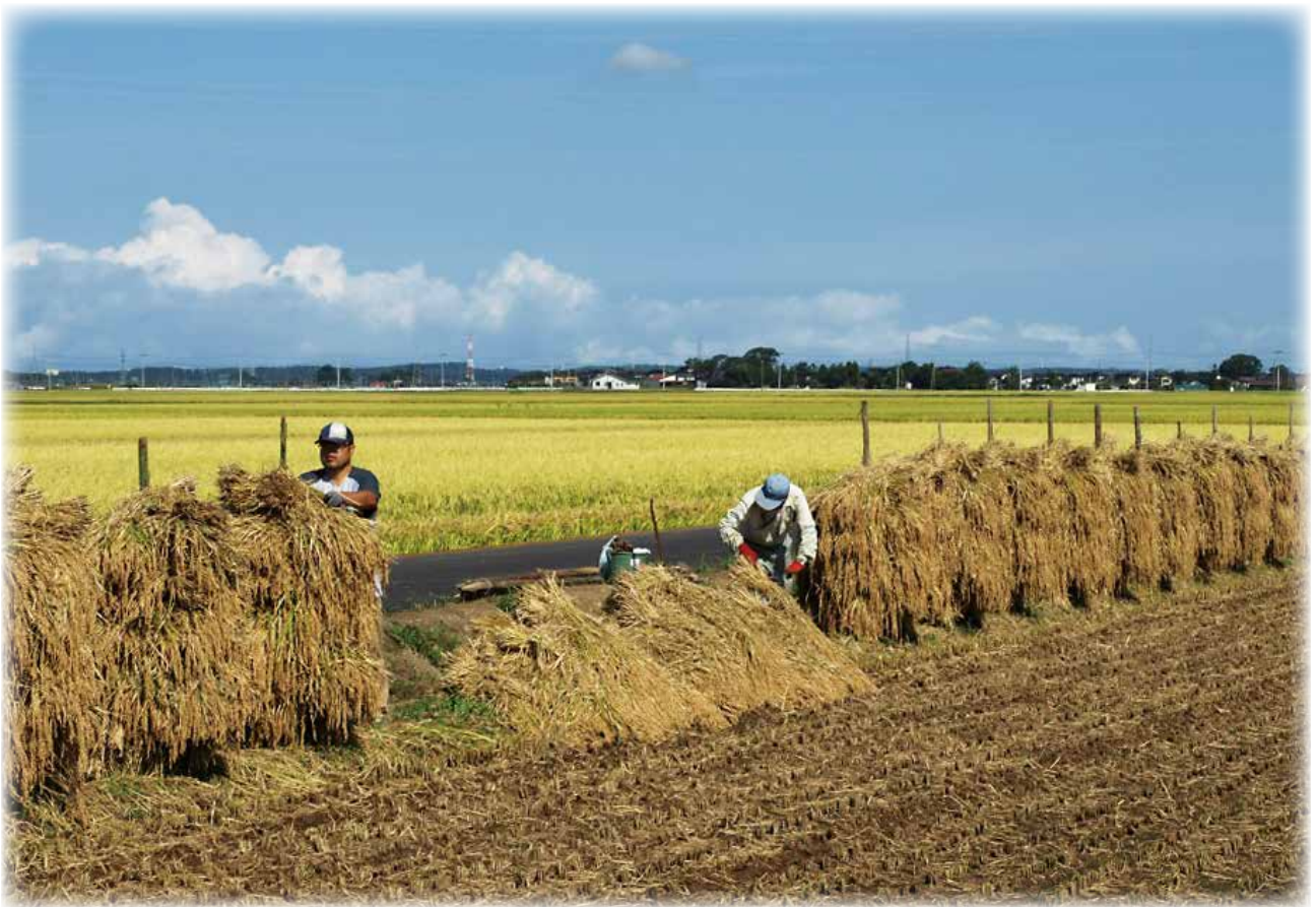
もち米「女鶴」の杭掛け作業（北平田地区・布目）