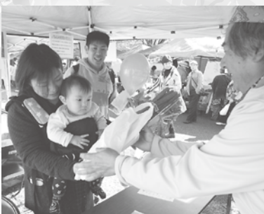
たくさん食べてね！