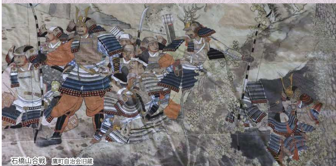
石橋山合戦 鷹町自治会旧蔵