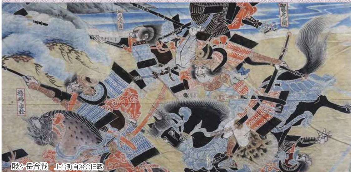
賤ヶ岳合戦 上台町自治会旧蔵