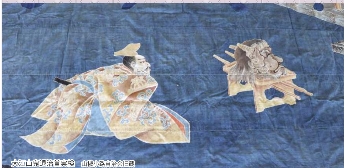
大江山鬼退治首実検 山椒小路自治会旧蔵