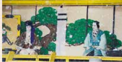
▲昨年 げんべい の舞台より本狂言「源平布引滝」

黒森歌舞伎は、江戸時代中期から黒森日枝神社に奉納されたといわれる農民歌舞伎で、280年以上にわたり黒森地区で伝承されてきました。今年も三日天下として知られる太閤記の明智光秀を主人公とした「絵本太功記」を平成14年以来15年ぶりに上演します。