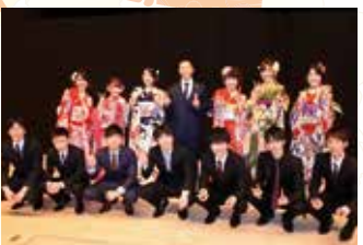
▲平成29年酒田市成人式実行委員の皆さん