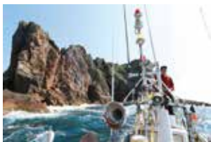
▲御積島の洞窟を船上から参拝

た溶岩は今から約1千万年前に海底火山から噴出したものだと考えられています。また本島の北の外れに浮かぶ二俣島は、日本海ができた1千500万年前に噴出した溶岩の島で、島中に柱状節理の断面になっています。コンバクトなエリアに変化に富んだ岩石や地形が見られる飛島。遊覧船に乗ってちょっとディープなジオツアーを堪能してみたいかがですか。