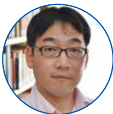
鳥海山・飛島ジオパーク推進協議会 専任研究員