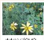
オオハンゴウアウ

自宅の敷地で見つけたら、 根から抜き、 必ず天日にさらすか 袋に入れて枯死させ、 もやすごみとして処分