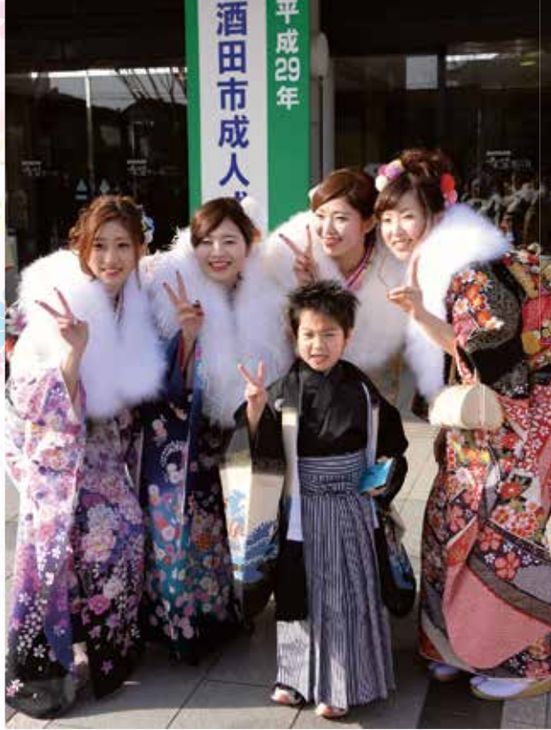
▲「3分の1成人式？」お兄ちゃんの成人式についてきた男の子と一緒に

1月8日、希望ホールで行われた成人式。スーツや色とりどりの晴れ着に身を包んだ約900人の新成人が参加し、大人の仲間入りを祝いました。天候にも恵まれ、笑顔と歓声があふれた当日の様子を写真で伝えます。