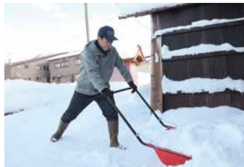
▲愛用のスノーダンプでどんどん除雪