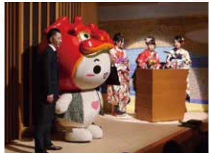
▲あのんも登場「おめでとうだのん」