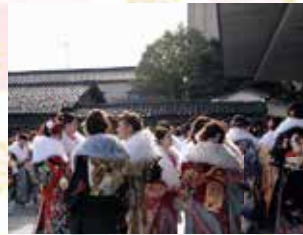
▲希望ホール前で、旧友との再会を喜ぶ