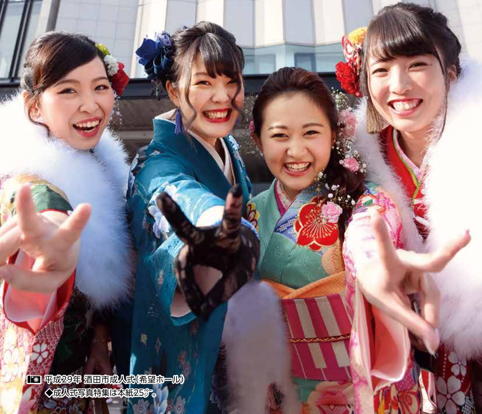
📷 平成29年 酒田市成人式(希望ホール)