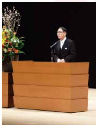
▲丸山市長も新成人を祝福