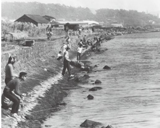
酒田港で釣りを楽しむ人々(昭和30年代)