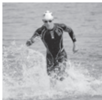
NZからの招待選手がみなと酒田トライアスロンおしんレースに参加(以降毎年招待予定)