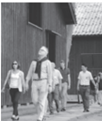
NZ駐在大使が酒田来訪