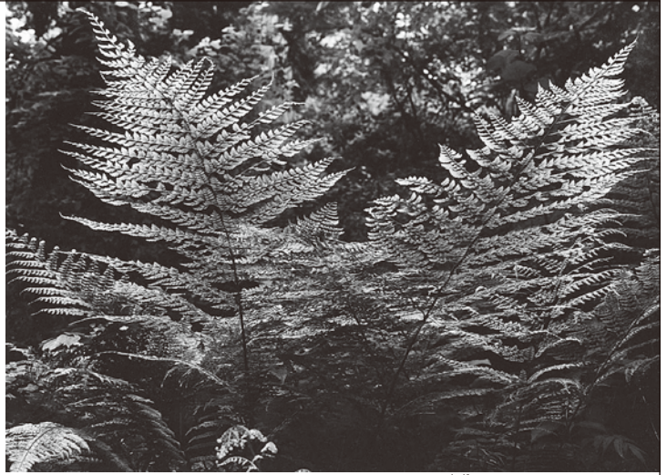
室生山暖地性羊歯群落 奥の院にて(夏)

同時開催として建築や仏像の細部の美、また初期の傑作である職人の手仕事に焦点をあてた作品も展示します。