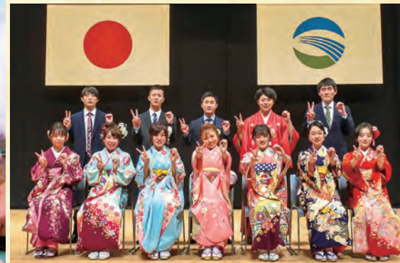
▲成人式実行委員の皆さん