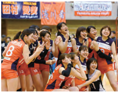
▲天童ホームゲームでの勝利に喜ぶ選手たち

の戦いを見守ってください！ 試合も少ないですが、私たちのホームゲームも含め、残りの