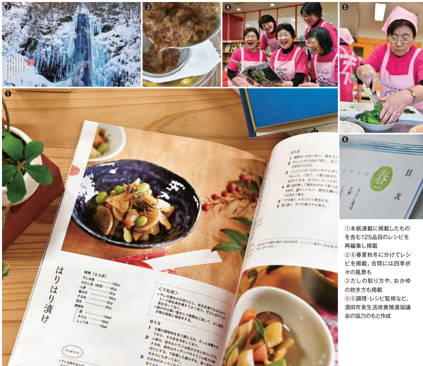
①本紙連載に掲載したものを 含む125品目のレシピを 再編集し掲載 ②③春夏秋冬に分けてレシ ピを掲載。合間には四季折 々の風景も ④だしの取り方や、おかゆ の炊き方も掲載 ⑤⑥調理・レシピ監修など、 酒田市食生活改善推進協 会の協力のもと作成