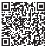
▲リフォーム補助金ホームページ QRコード