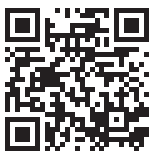
▲やまがた子育て応援パスポート申請フォーム