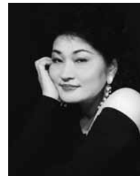
【メゾ・ソプラノ】 森山京子