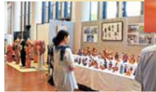
▲昨年のホワイエでの作品展示