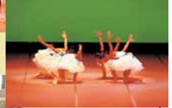
▲一昨年のステージ部門の発表