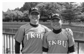
横田監督(左)と侃さん(右)

この経験を社会に出てからも生かせるよう、現状に満足せず今後も努力していきたいと思