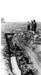
最初に発見された角材列(昭和6年)