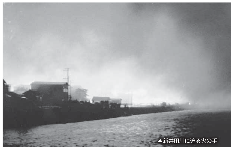
▲新井田川に迫る火の手