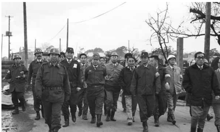
▲林消防庁長官（当時）を中心とした視察団