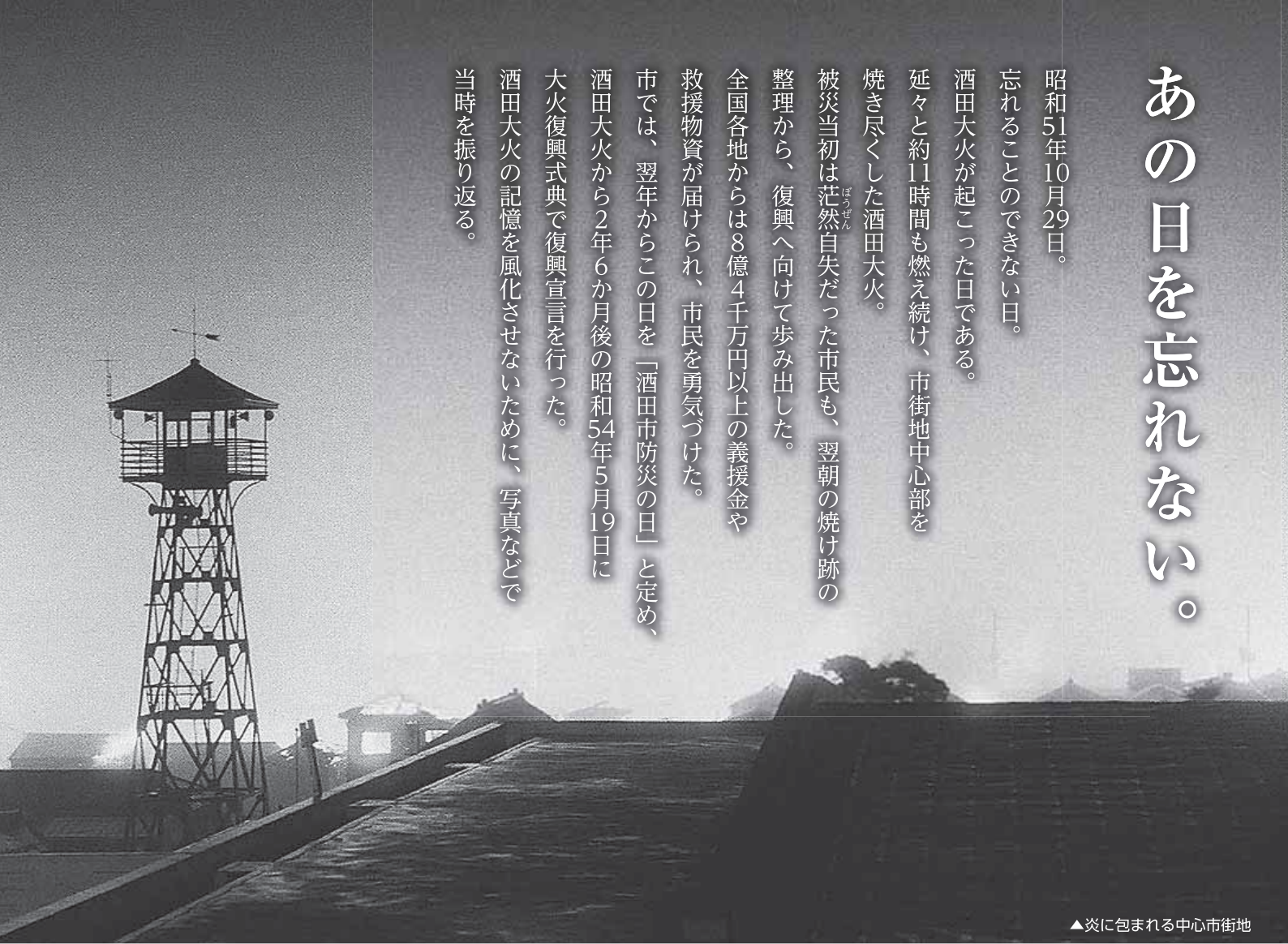
▲炎に包まれる中心市街地