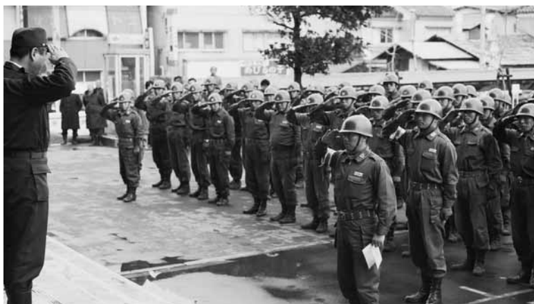
▲市役所駐車場での自衛隊歓送会