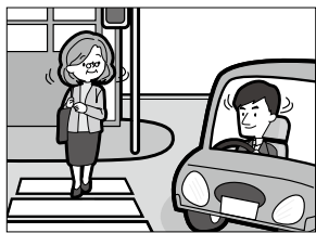
▲ドライバーも歩行者もしっかり左右の確認を