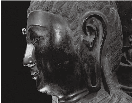
薬師寺東院堂観音菩薩立像(聖観音)頭部