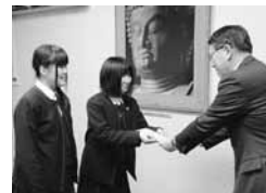
▲県立酒田東高等学校吹奏楽部