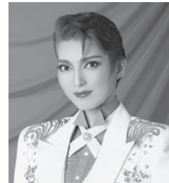
朝夏まなと ◎宝塚歌劇団(イメージ)