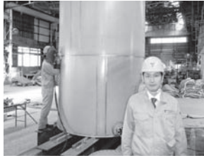
工場内でのステンレス製タンクの溶接作業風景