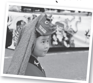
▲第53回ジュニアの部特選作品「僕かわいいでしょ」(単写真)