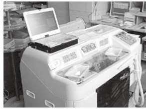
▲全自動調剤分包包機

収益的収支では、入院・外来収益などの総収益が7億1千344万円です。一方、給与費、材料費などの総費用は、7億380万円です。その結果、総収益から総費用を差し引いた964万円が純利益として計上される見通しです。 資本的収支では、医療機器等整備の建設改良事業として大腸ビデオスコプや全自動調剤分包包機などの更新導入を行い、建設改良費、企業債償還金で1億83万円の支出となりました。支出への充当財源としては、企業債、出資金の収入9千392万円を充て、なお不足する額691万円は、損益勘定留保資金などで補填する予定です。今後とも、良質な医療サービスの提供と医療環境の整備、地域医療の充実に努めていきます。