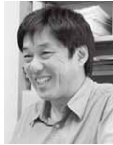
秋田大学教育文化学部教授、火山地質学専門