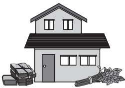
家の周囲に燃えやすいものを置かない