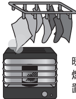
暖房器具の近くに燃えるものを置かない

火災予防条例の改正により、平成23年6月1日から全ての住宅に住宅用火災警報器の設置が義務付けられています。大切な自分の命や家族の命を火災から守るため、早めに設置しましょう。