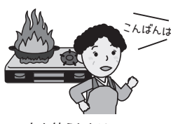
火を使うときはその場を離れない