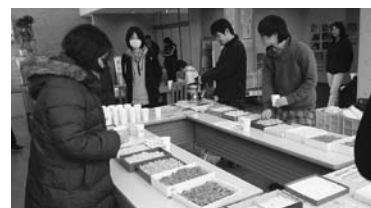
▲公益大でのキャンドル製作風景

来る3月11日(水)午後6時~8時に、中町商店街でそのキャンドルに火を灯すなどのイベントを行います。当日は多くの方が火を灯し、東日本大震災に関わる全ての人が前向きに希望を持って未来に歩む一助になればと願っています。