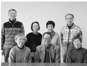
▲はまなすの皆さん

「点字を一つ間違 うと別の文字に なってしまうま す」と苦笑しま すが、ルールは る6つの点で一 文字を表します。 「点を一つ間違 うと別の文字に なってしまうま す」と苦笑しま すが、ルールは