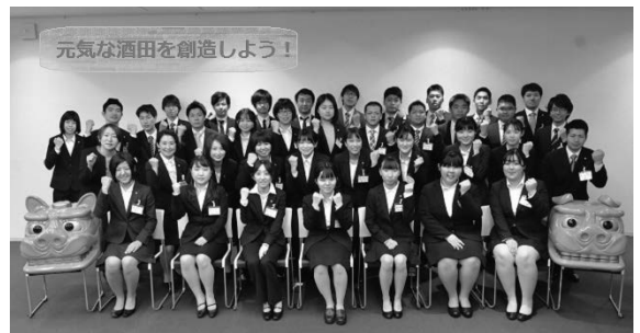
令和2年度新規採用職員▶

◆新型コロナウイルス感染症の状況や、政府、県の対策などにより試験日や会場を変更する場合があります。その際は市ホームページなどでお知らせするとともに、申込者に通知します。