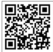
▲特設ホームページ

申し込み／地元募金特設ホームページからインターネットで手続きもしくは市役所6階交流観光課へ直接