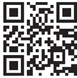
▲キャンペーン公式ホームページ