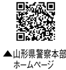
▲山形県警察本部ホームページ