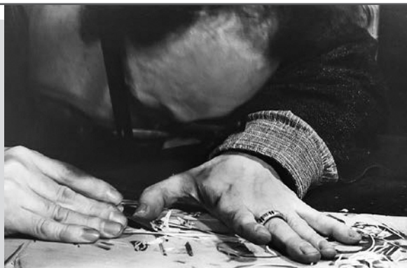
土門拳(棟方志功 板を彫る)1954年

会期 / 1月19日(金) ▶ 3月31日(日) 開館時間 / 午前9時～午後5時(最終入館は午後4時30分) 休館日 / 月曜日(祝日の場合は翌日) 入館料 / 一般800円、高校生400円、中学生以下無料