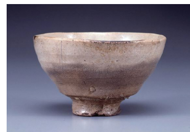
▲重要美術品 大井戸茶碗 銘 酒井 朝鮮・朝鮮時代(16世紀)