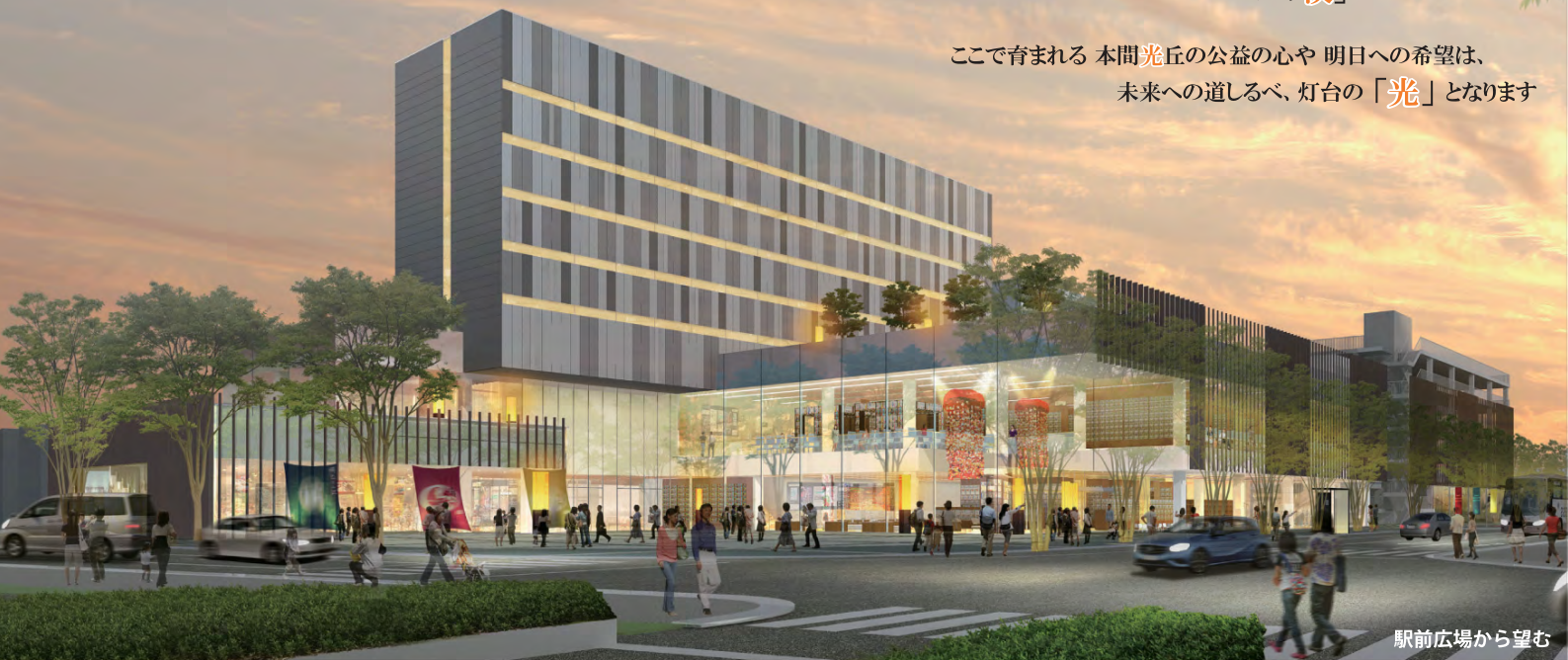
駅前広場から望む

歴史と伝統がある「港町・酒田」の陸の玄関口に、 人やモノが出会う「湊」をつくります