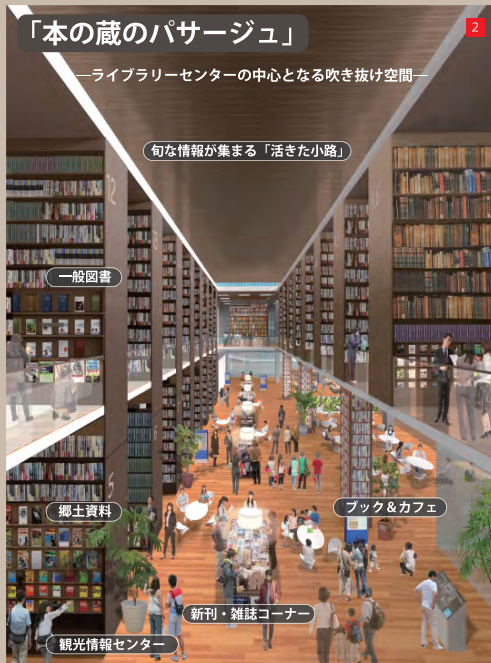
人々が集い 時を過ごす様子が見れる 出会いと交流の舞台