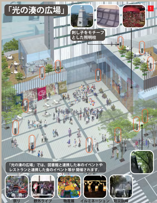
心地よい時間の流れを感じる寛ぎの場所（駅前広場とつながる広場）