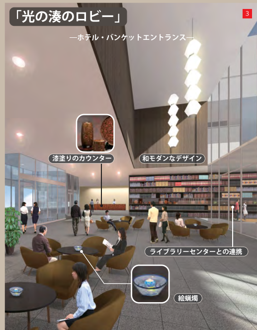
ライブラリーセンターからホテルにつながる 上質な おもてなし空間