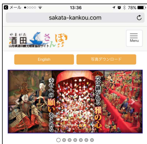
図5 正常に接続できればインターネットが ご利用できます。