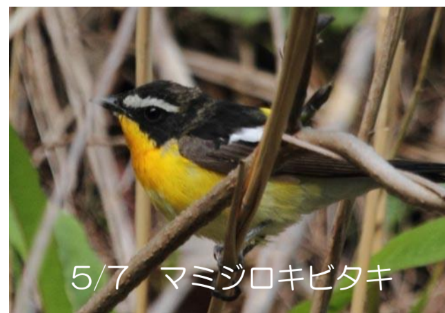
5/7 マミジロキビタキ