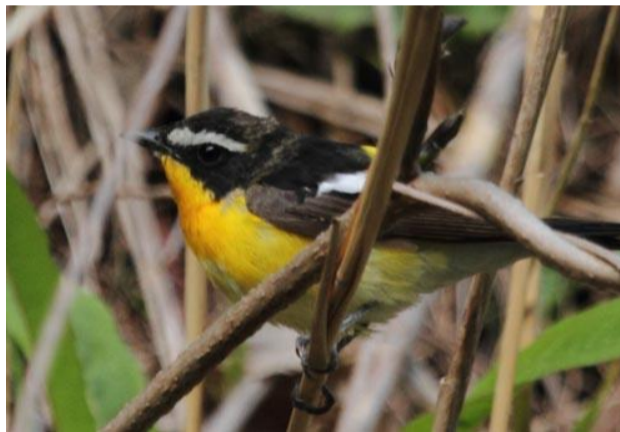
5/7 マミジロキビタキ