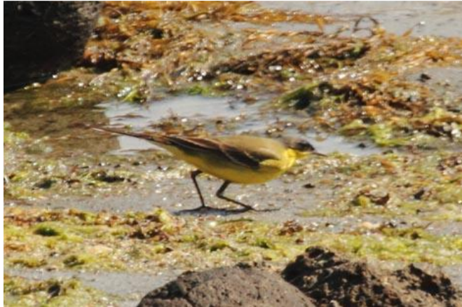
5/1 キタツメナガセキレイ