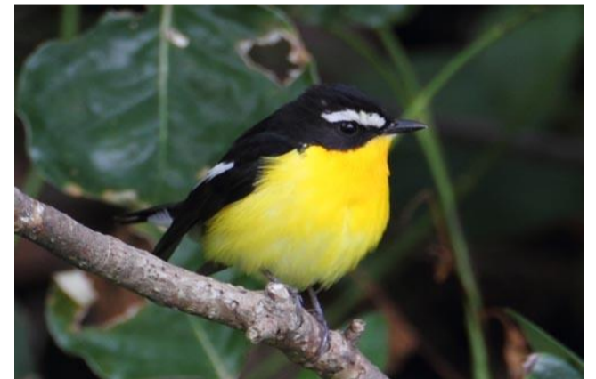
5/9 マミジロキビタキ