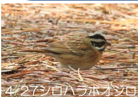
4/27シロハラホオジロ

雨上がりでほとんどの種が一気に抜けた感じ。 ツグミとアトリが目立つ。 ・シロエリオオハム冬羽1（学校前沖） ・クロサギ1（荒崎） ・ムジセッカ1（2の畑） ・ノゴマ♂1（ヘリポート） ・コマドリ複数 ・コルリ複数