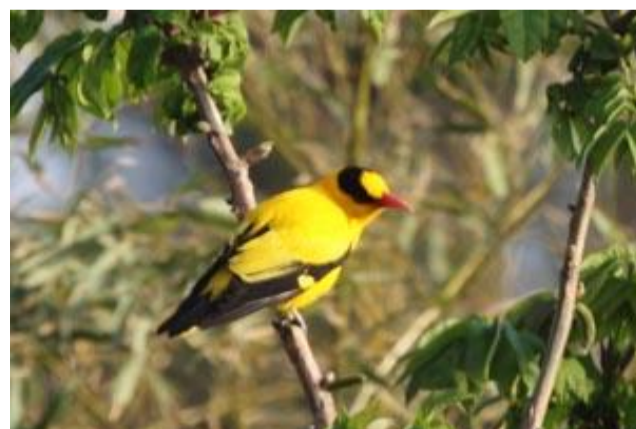
5/11 コウライウグイス