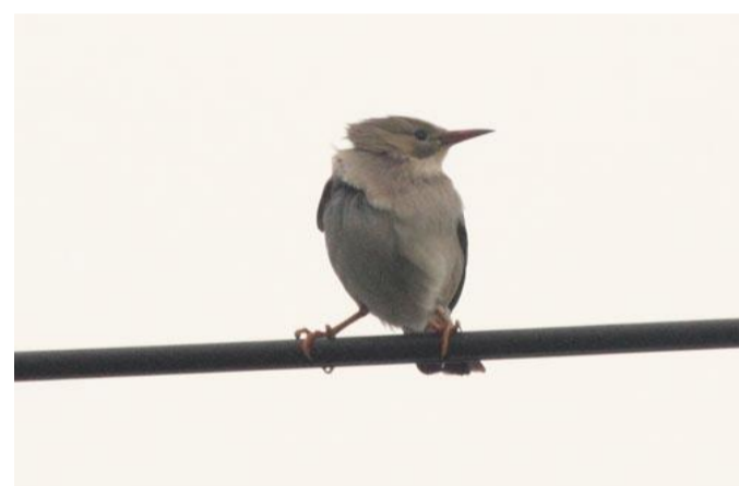
4/29 ギンムクドリ ♀