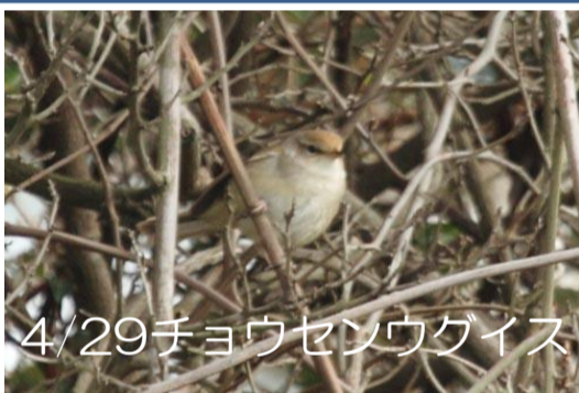
4/29チョウセンウグイス