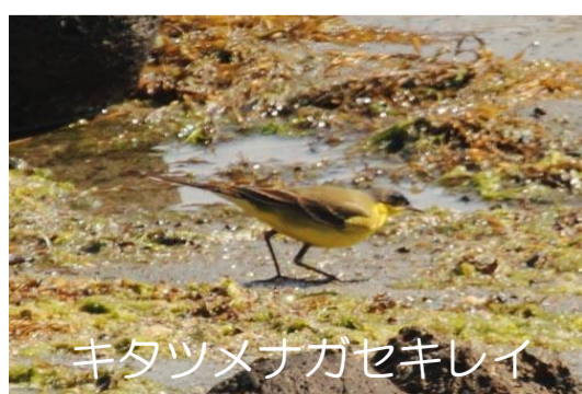
キタツメナガセキレイ