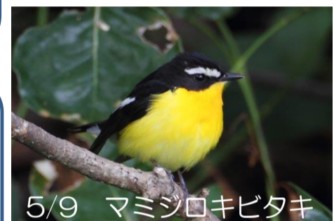
5/9 マミジロキビタキ