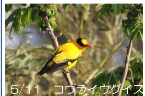
5/11 コウライウグイス