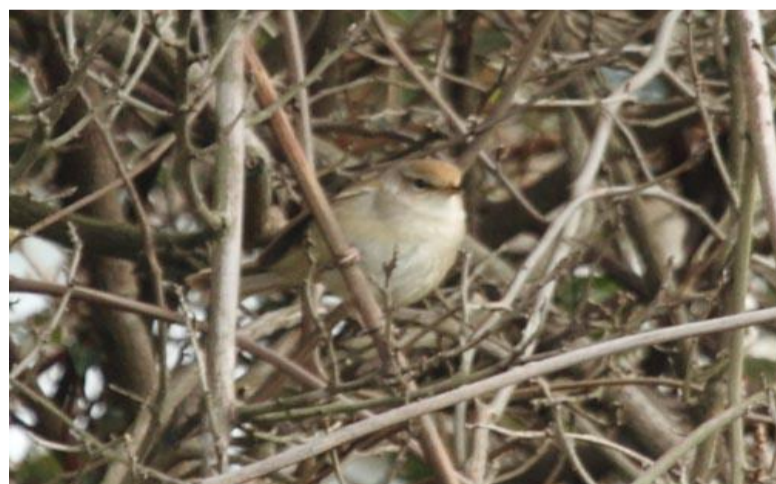
4/29 チョウセンウグイス