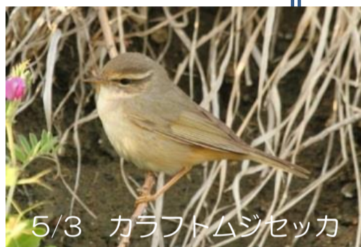
5/3 カラフトムジセッカ