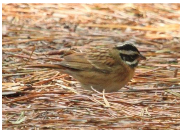
4/27 シロハラホオジロ ♂