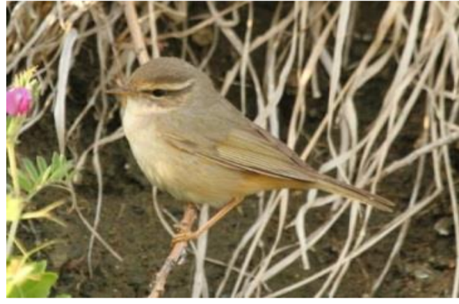
5/3 カラフトムジセッカ