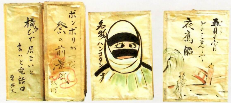
三居稲荷の地口行灯