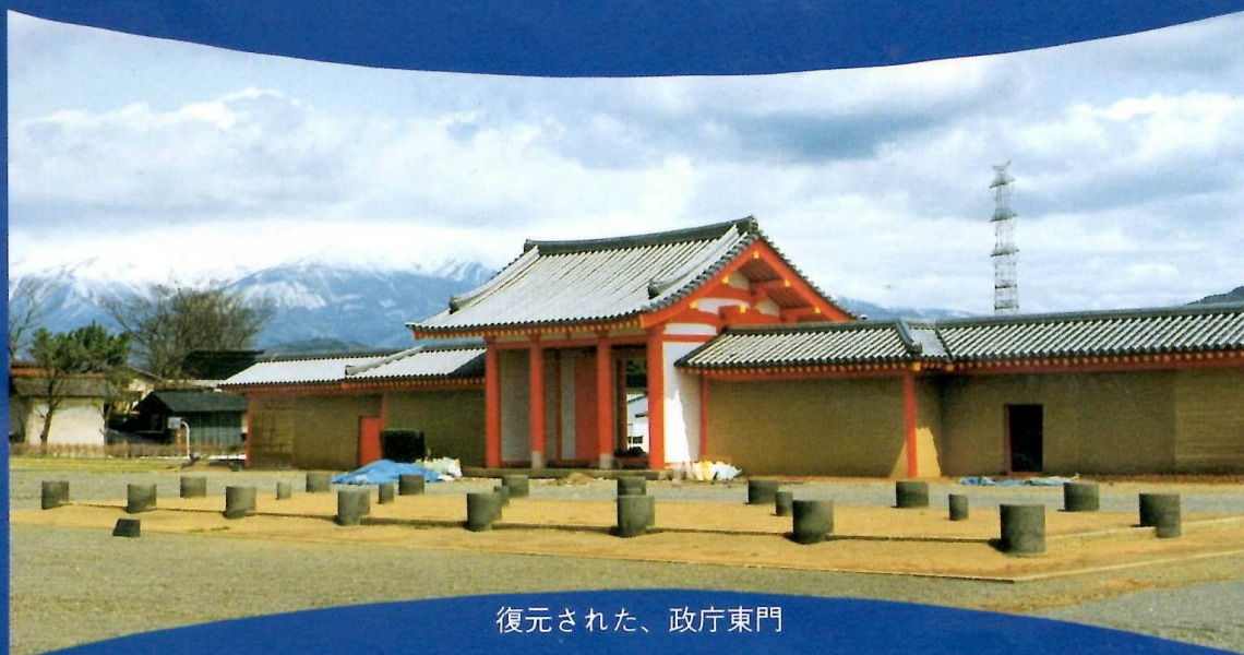
復元された、政庁東門

開館期間 平成4年4月23日(木)～7月12日(日) 開館時間 午前9時～午後4時30分 休館日 なし 入場料 おとな100円・児童・生徒50円 65歳以上の方と身体障害者の方は無料です