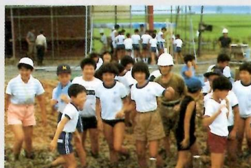
⑨壁土を踏む、体験学習(本楯小)