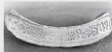
⑥破片も「情報の缶詰」