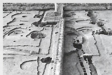
④遺構(東門)の完掘状況