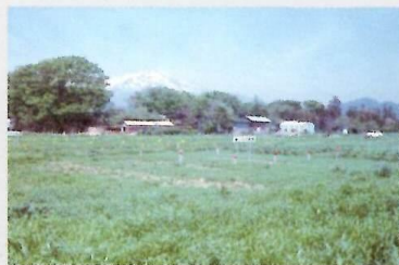
①史跡城輪柵跡全景