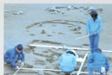
⑤精密な平面実測作業