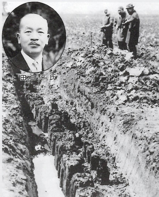
▶最初発見の角材列