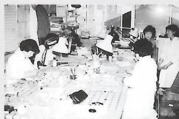
⑧正確な記録作りと整理