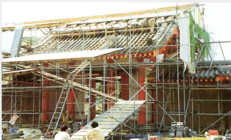
⑩研究の成果を踏まえ、復元工事中の東門