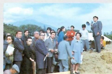
⑦現地での公開説明会